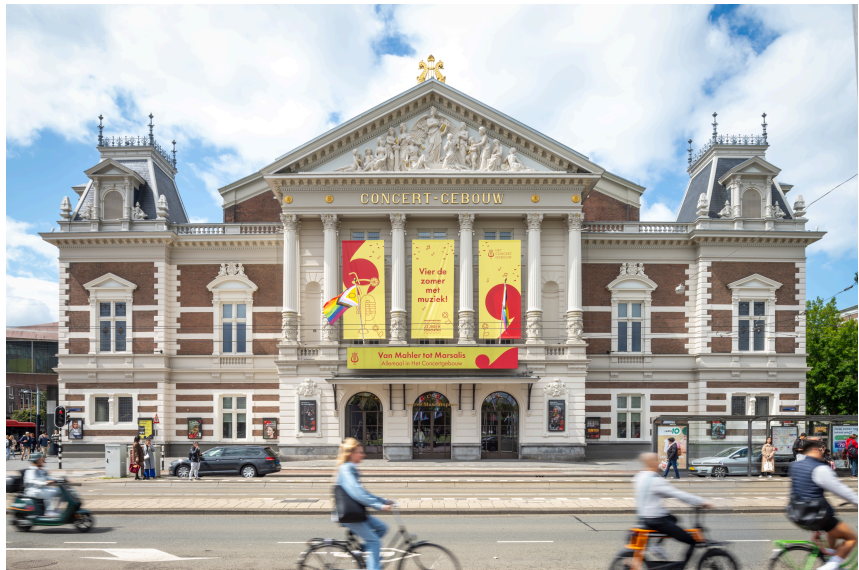
© Hans Hodes (Studio HOD) Hans Hodes (Studio HOD)